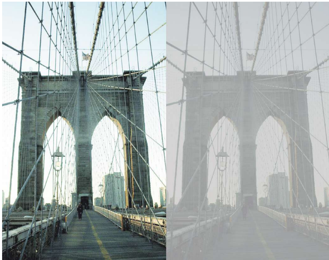
Unterschiede im visuellen Kontrast: Fotografie unter hohem Kontrast (links) und mit künstlich reduziertem Kontrast (rechts).