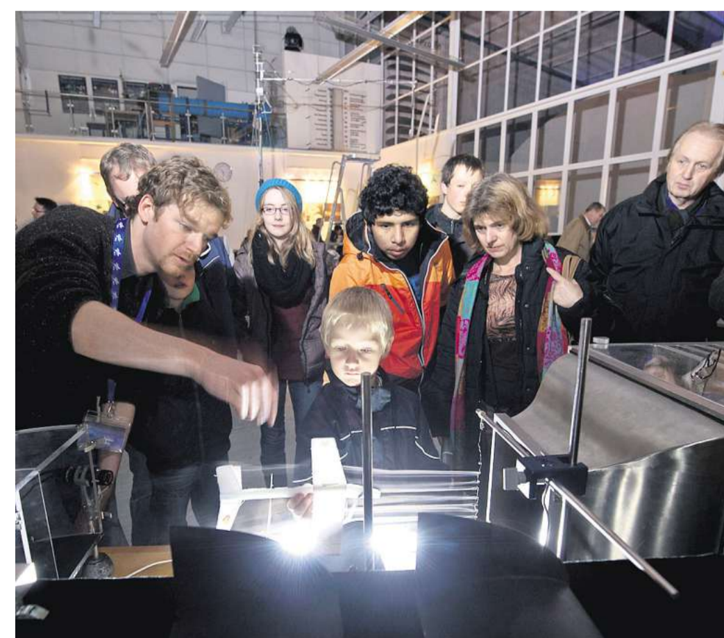
Strömungsforschung zum Anfassen im DLR: Warum fliegt ein Flugzeug?