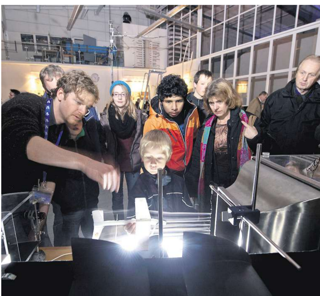
Strömungsforschung zum Anfassen im DLR: Warum fliegt ein Flugzeug?