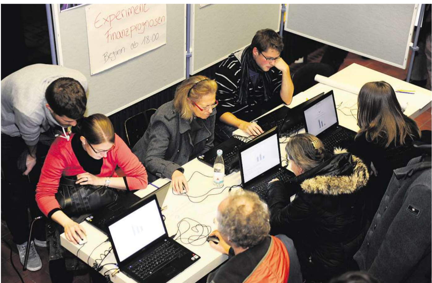
Im Zentralen Hörsaalgebäude: Beim Experiment Finanzprognosen helfen Wissen und Intuition.