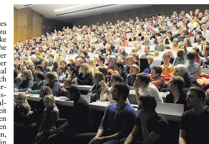
Jeder Platz besetzt: Hörsaal der Fakultät für Chemie.